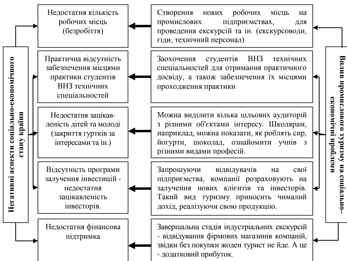
Рис. 3. Вплив промислового туризму на вирішення соціально-економічних проблем

Отже, перейнявши досвід зарубіжних країн, промисловий туризм стає однією з умов соціально-економічного розвитку, вирішуючи ряд соціальних та економічних проблем стану країни (рис. 3).