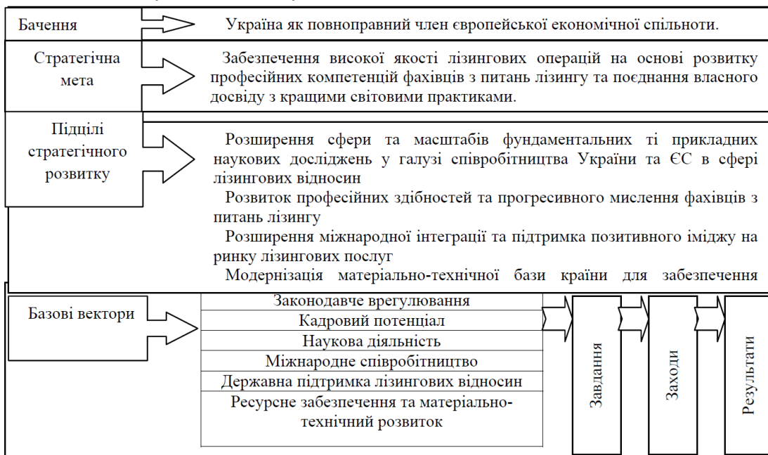
Рис.2. Концептуальна модель стратегічного розвитку лізингу в контексті євроінтеграції

Висновки та пропозиції. Задля усунення означених перешкод та маючи на увазі висвітлені переваги, необхідно розробити та виконати комплекс завдань, які згруповані за базовими векторами розвитку.