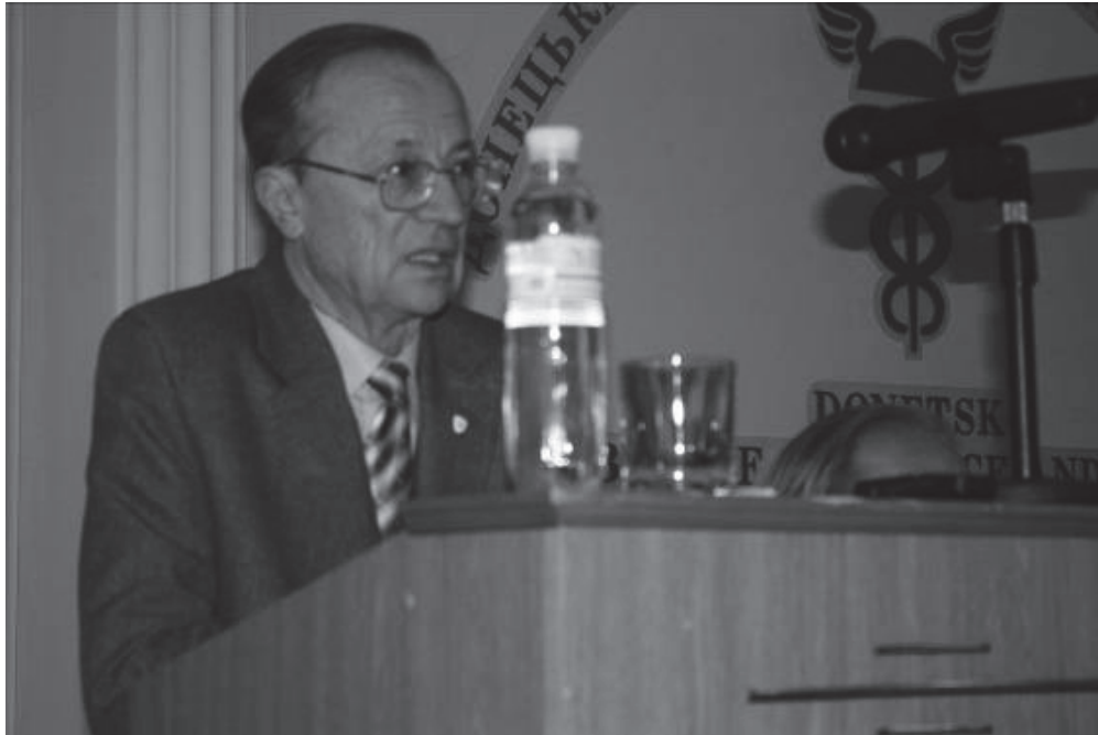
Амоша О.І., директор Інституту економіки промисловості НАН України, академік НАН України, д.е.н., професор