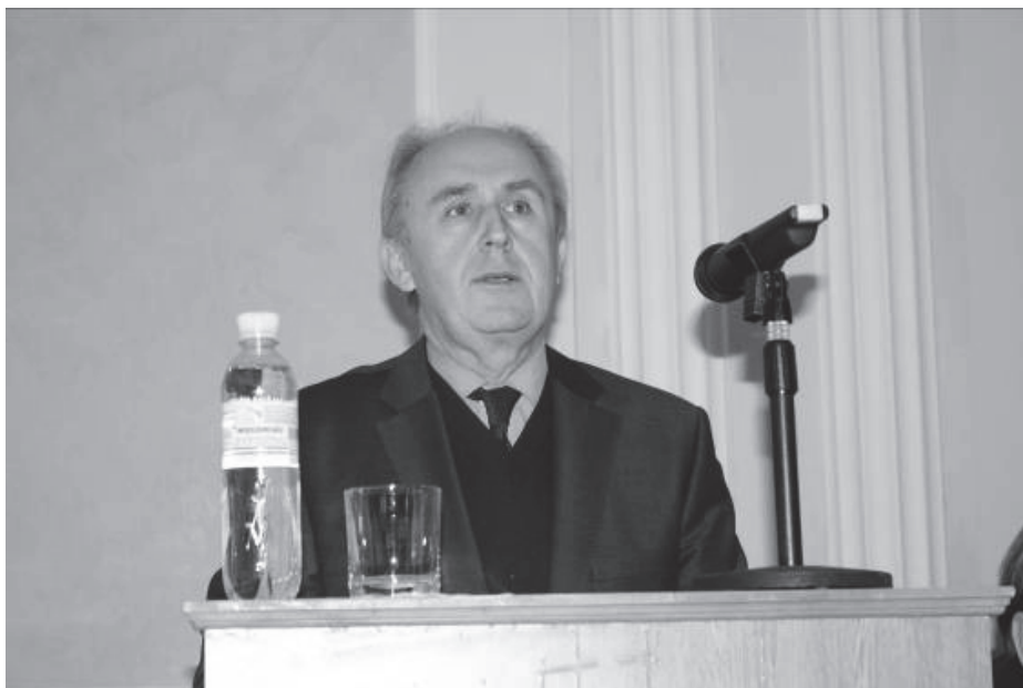
в.о. ректора Донецького національного університету, д.е.н., професор