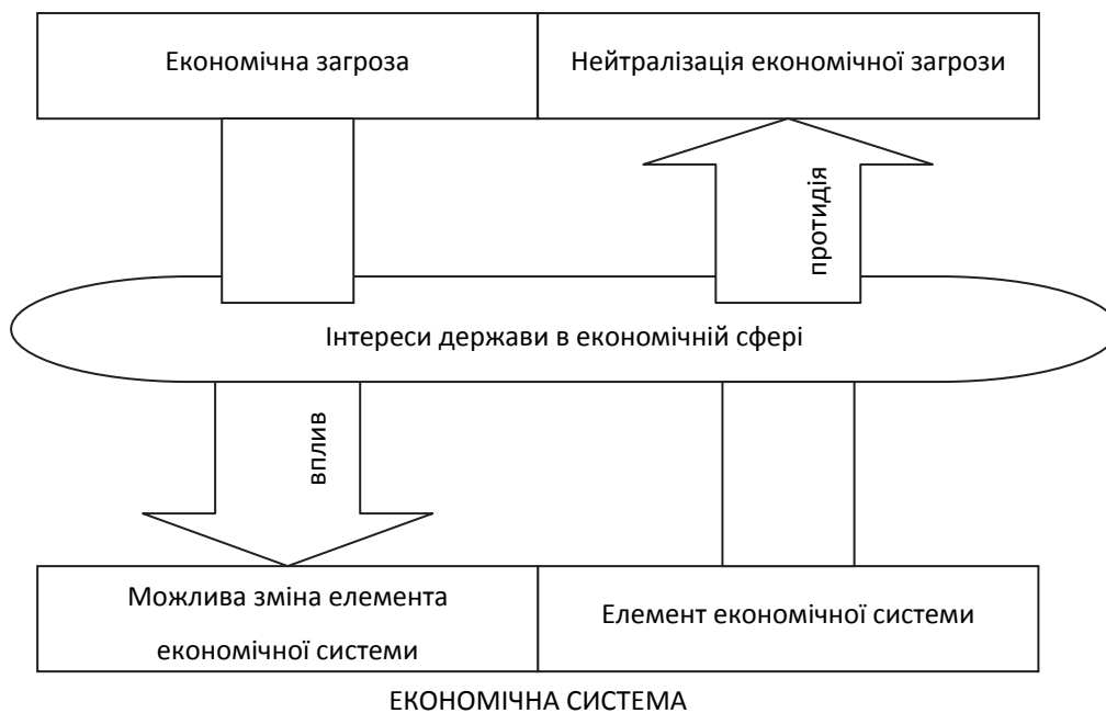
Рис. 1. Системний підхід до економічної безпеки

Таке тлумачення економічної безпеки дозволяє її розглянути з позиції системного підходу, за допомогою якого можна розкрити сутність економічної безпеки і дати визначення основним поняттям (рис. 1).