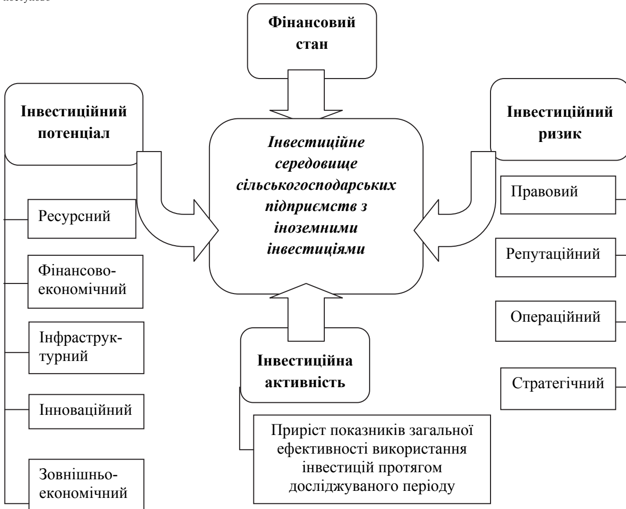
Рис. 1. Основні фактори, що формують інвестиційне середовище сільськогосподарських підприємств з іноземними інвестиціями