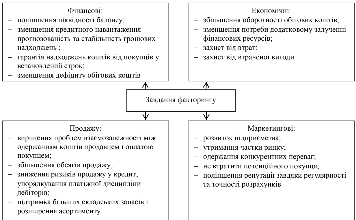
Рис. 3. Завдання факторингових операцій для сільськогосподарських підприємств.

Сучасний ринок факторингових послуг представляють лише близько десяти банківських установ, які мають низку спеціальних умов до потенційних клієнтів: переведення рахунків підприємства на обслуговування, максимальна кількість дебіторів не перевищує п’яти покупців, встановлюється мінімальна сума обслуговування не менше 50 тис. грн, може надаватися забезпечення у вигляді нерухомого майна. Термін оформлення факторингових операцій встановлюється терміном 30 та 60 днів, а ставка фінансування знаходиться в межах 19-23% річних, комісія за обслуговування встановлюється в середньому в розмірі 0,1% від суми ліміту щомісячно. Переважно максимальний обсяг фінансування за факторингом не перевищує 90% від суми платежу, хоча може бути визначений і на рівні 60% [4; 5].