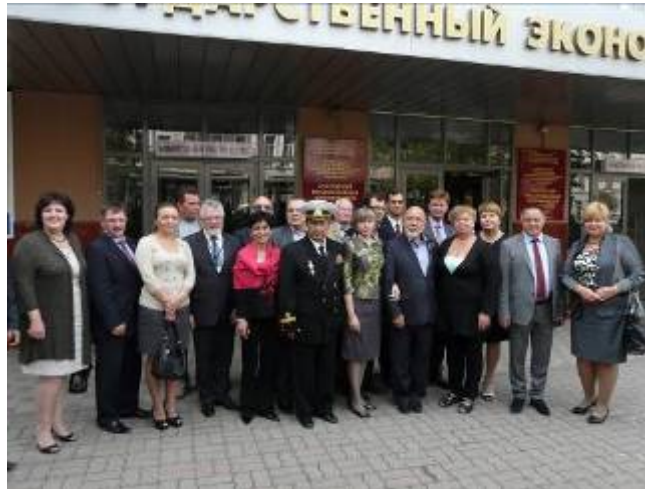
Общее фото на память перед входом в РГЭУ (РИНХ)

Сложная задача достижения баланса национальных интересов странами-участниками ОЧЭС возможно лишь на основе разумного компромисса, поиска таких неимперских и неконфронтационных стратегий сотрудничества, которые смогут обеспечить развитие региональных интеграционных процессов, ускорение темпов экономического роста, повышение уровня международной конкурентоспособности, снижение инфляции, рост занятости и другие положительные экономические сдвиги. Как известно, каждый уровень интеграции означает утрату части экономического, а значит, и политического суверенитета стран-участников в пользу всей региональной группировки или даже единого наднационального органа, наделенного правом принятия решений без согласования с правительствами стран-участников. В связи с отмеченным, каждая из стран ОЧЭС должна быть готовой к частичной потере суверенитета взамен получения эффекта синергии и масштаба, а также других преимуществ интеграции. ЧЭС должна быть не просто суммой экономик разных стран, но и плюс к этому иметь самостоятельный организационный и экономический механизмы, которые обеспечат достижение поставленных целей. Кроме того, сотрудничество в рамках ЧЭС может и должно внести свой вклад в достижение мира и стабильности в регионе.