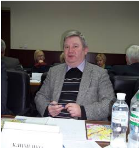
контексті підписання Угоди з ЄС, викликає підприємства на сьогодні не готові.