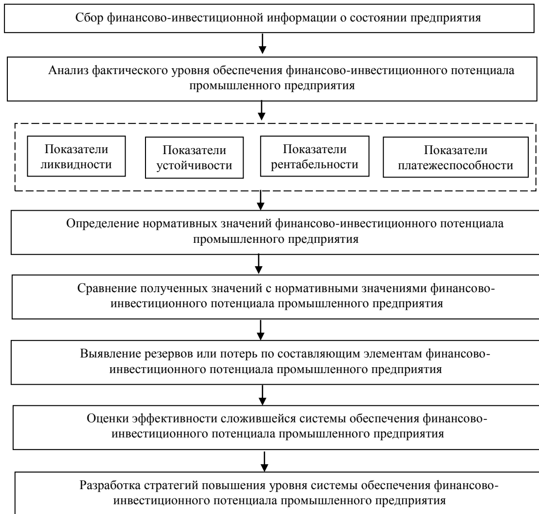
Рис. 1. Модель оценки обеспечения финансово-инвестиционного потенциала промышленного предприятия (составлено автором)

В теории менеджмента отсутствует единый методологический подход к эффективному обеспечению финансово-инвестиционного потенциал промышленного предприятия [14]. Результаты анализа существующих методик, практическая необходимость в доступном и обоснованном методе управления позволили разработать механизм обеспечения финансово-экономического потенциала промышленного предприятия. Под механизмом обеспечения потенциала понимается последовательный комплекс процессов (планирования, организации, контроля, мотивации), характеризующихся набором взаимосвязей и взаимодействий и призванных решать вопросы формирования и развития финансово-инвестиционного потенциала предприятия, уровня и эффективности его использования.