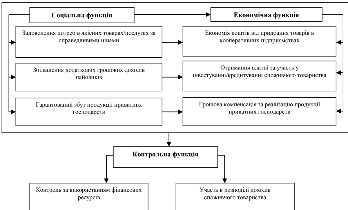
Рис. 1. Взаємозв'язок функцій економічної участі пайовиків у діяльності споживчого товариства (узагальнено автором)

На нашу думку, застосування такого типу економічної участі пайовиків в діяльності кооперативних організацій України сприяло би більш коректному визначенню чисельності фізичних осіб, які користуються перевагами функціонування кооперативних підприємств, оскільки на практиці за рахунок індивідуального членства задовольняються потреби всіх членів родини пайовика. Втім, слід зазначити, що його впровадження потребує розробки механізму врахування складу сім'ї і подальших її змін (вибуття членів, їх смерті тощо).