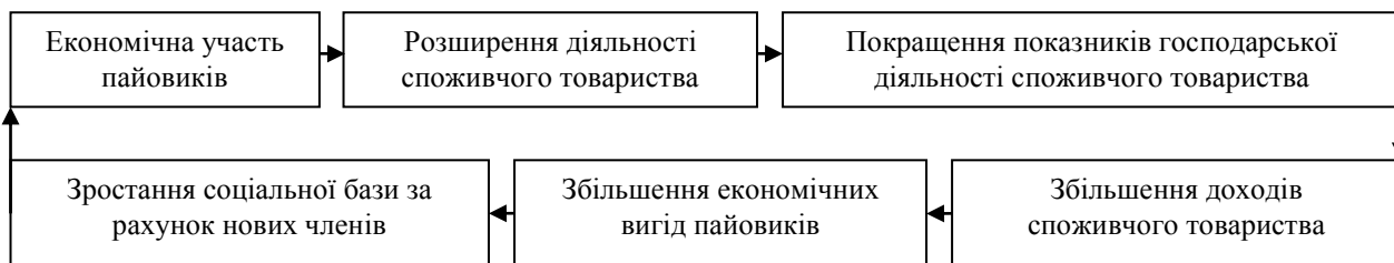
Рис.3 Вплив економічної участі пайовиків на функціонування споживчого товариства. (запропоновано автором).

Споживчі товариства, формуючи власну соціальну базу, сприяють збільшенню обсягів діяльності (товарообігу, виробництва тощо) і зміцненню фінансового стану своїх організацій. Це, в свою чергу, створює потенціал розширення соціальної бази споживчої кооперації і забезпечує вступ нових членів (рис.3).