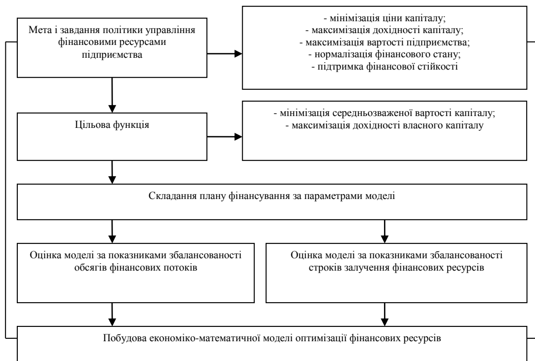
Рис. 1. Процес моделювання оптимізації фінансових ресурсів сільськогосподарських підприємств.

враховуючи вплив зовнішніх і внутрішніх факторів. Планування постійних фінансових ресурсів, на відміну від сезонних, згладжує негативні наслідки від небажаних відхилень, що існують у виробничо-господарській діяльності сільськогосподарського підприємства та забезпечує йому можливість виявлення резервів для ефективної фінансово-господарської діяльності. Для оптимізації використовується метод складання планових показників, який спрямований визначити обсяг вхідних і вихідних фінансових ресурсів майбутнього періоду, забезпечити покриття витрат підприємства в будь-який період часу завдяки різним джерелам фінансових ресурсів.