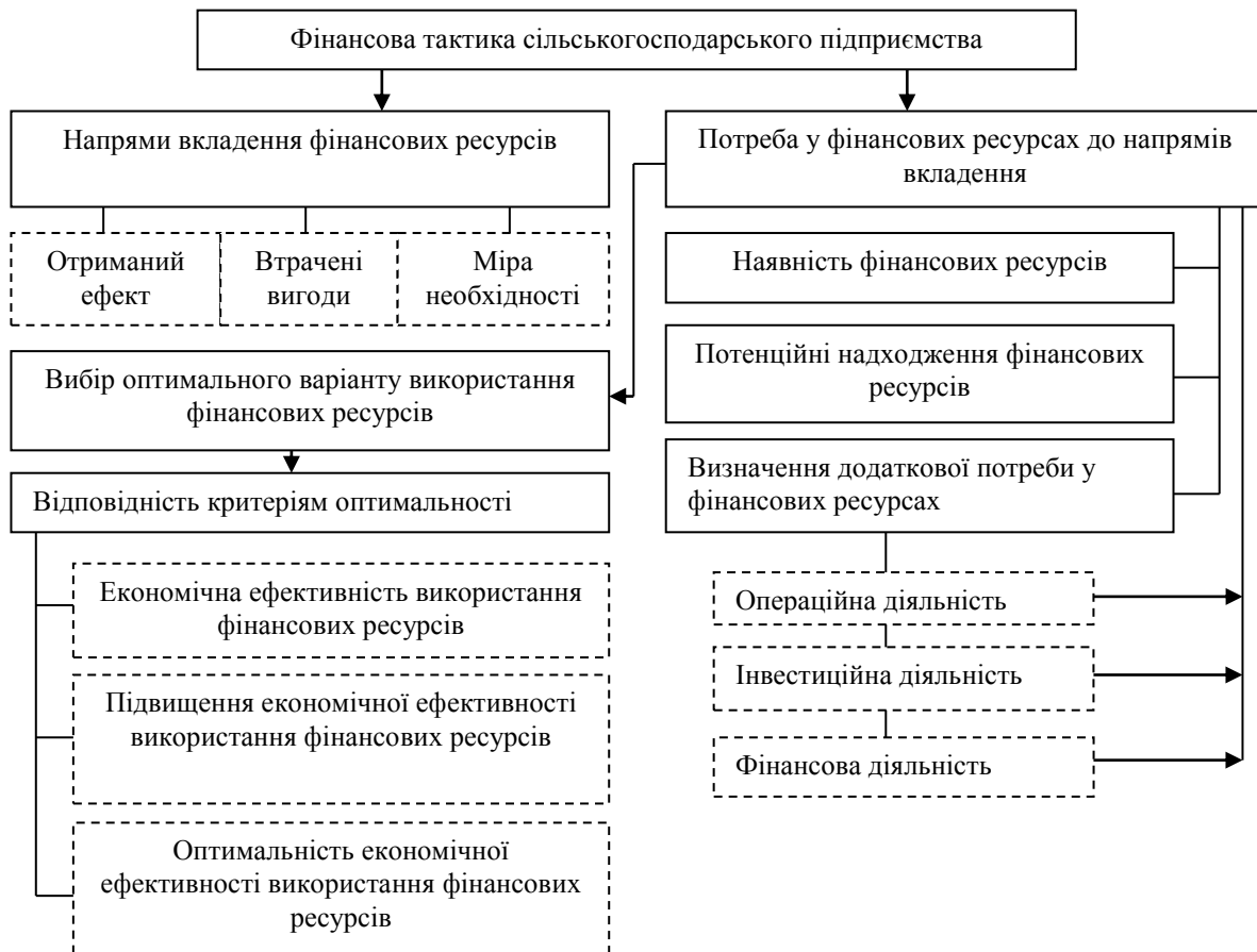
Рис. 3. Схема оптимального використання фінансових ресурсів сільськогосподарських підприємств.

Система контролю за рухом фінансових ресурсів повинна включати такі елементи, як: функції організаційних підрозділів; центри відповідальності за виконанням встановлених планових показників; схеми руху інформаційних ресурсів про зміни фінансових ресурсів для прийняття управлінських рішень щодо корегування планових показників; чинники, що впливають на обсяг, швидкість і термін руху фінансових ресурсів. На нашу думку, запорукою здійснення стратегії ефективного управління фінансовими ресурсами сільськогосподарського підприємства є можливість розробки і застосування фінансової стратегії, яка б слугувала стратегічною програмою формування фінансових ресурсів підприємства за рахунок власних і залучених зовнішніх коштів, їх розподілу між корпоративними, функціональними та конкретними стратегіями, а також забезпечення їхнього ефективного використання в процесі реалізації стратегії.