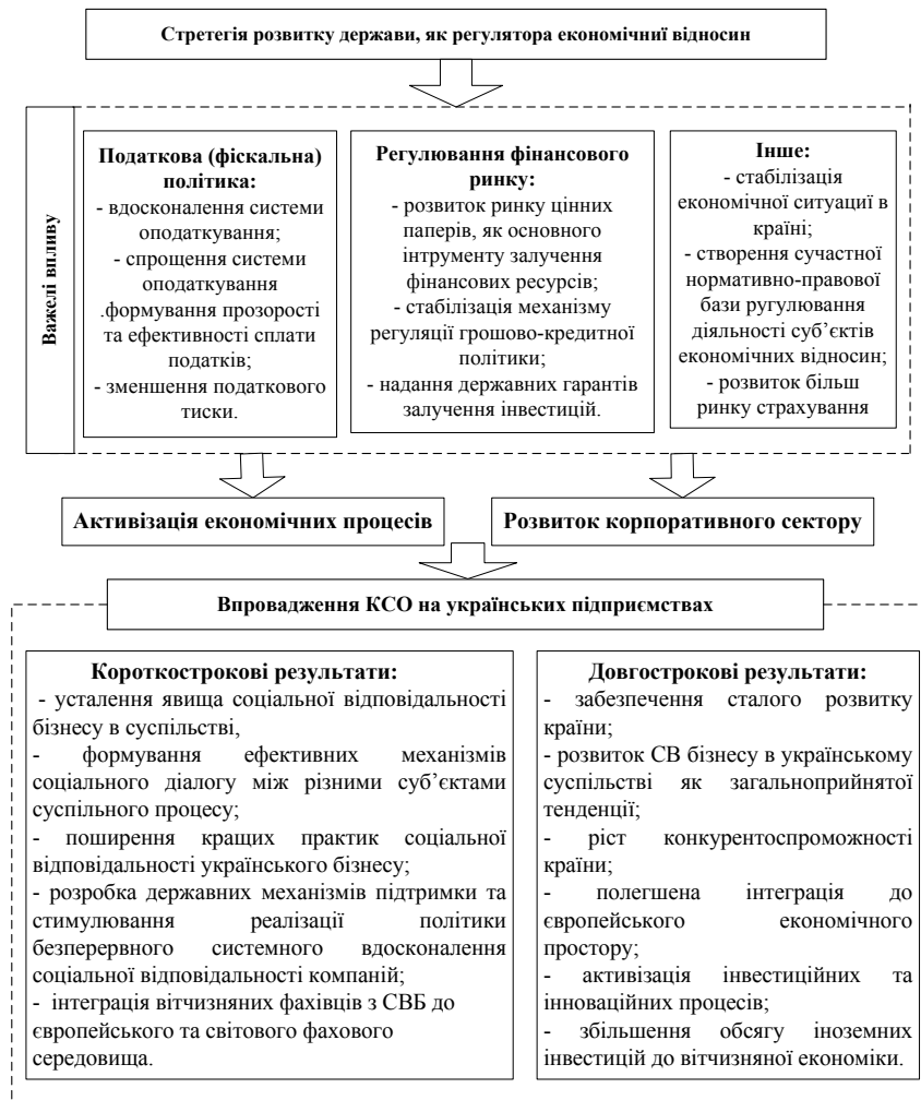
Рис. 2. Взаємозв'язок між впровадженням КСВ та сталим економічним розвитком країни

Рівень розуміння соціальної відповідальності у 2010 році порівнянні з 2005 роком практично не змінився: частка підприємств, які відносять до соціальної відповідальності надання благодійної допомоги громаді та розвиток власного персоналу, протягом останніх п'яти років залишається достатньо великою; незмінним залишилась частка підприємств (майже третина) які асоціюють здійснення екологічних проектів та участь у регіональних програмах розвитку із соціальною відповідальністю; найменша частка підприємств як у 2005 році, так і у 2010-му, віднесла до соціальної відповідальності такий її аспект, як відкритість компанії [5, с. 16].