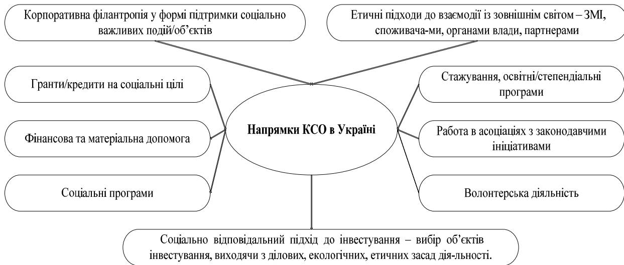
Рис. 4. Напрямки розвитку КСВ в Україні

Переважну частину заходів із соціальної відповідальності, які впроваджують підприємства, можна віднести до трудових практик (заходи із розвитку власного персоналу, відмова від використання примусової та дитячої праці, відсутність дискримінації, впровадження програм поліпшення умов праці) та захисту здоров'я і безпеки споживачів. Найменш поширеним для українських підприємств, які впроваджують соціально відповідальні заходи, є захист природних ресурсів та співпраця з громадою.