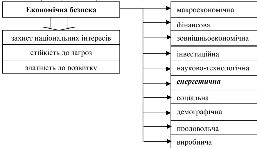
Рис.1. Складові економічної безпеки України

В свою чергу, поняття «економічна безпека» включає ряд різних сфер діяльності держави і суспільства, в яких теж має регулюватися баланс розвитку та забезпечуватись безпека (Рис.1).