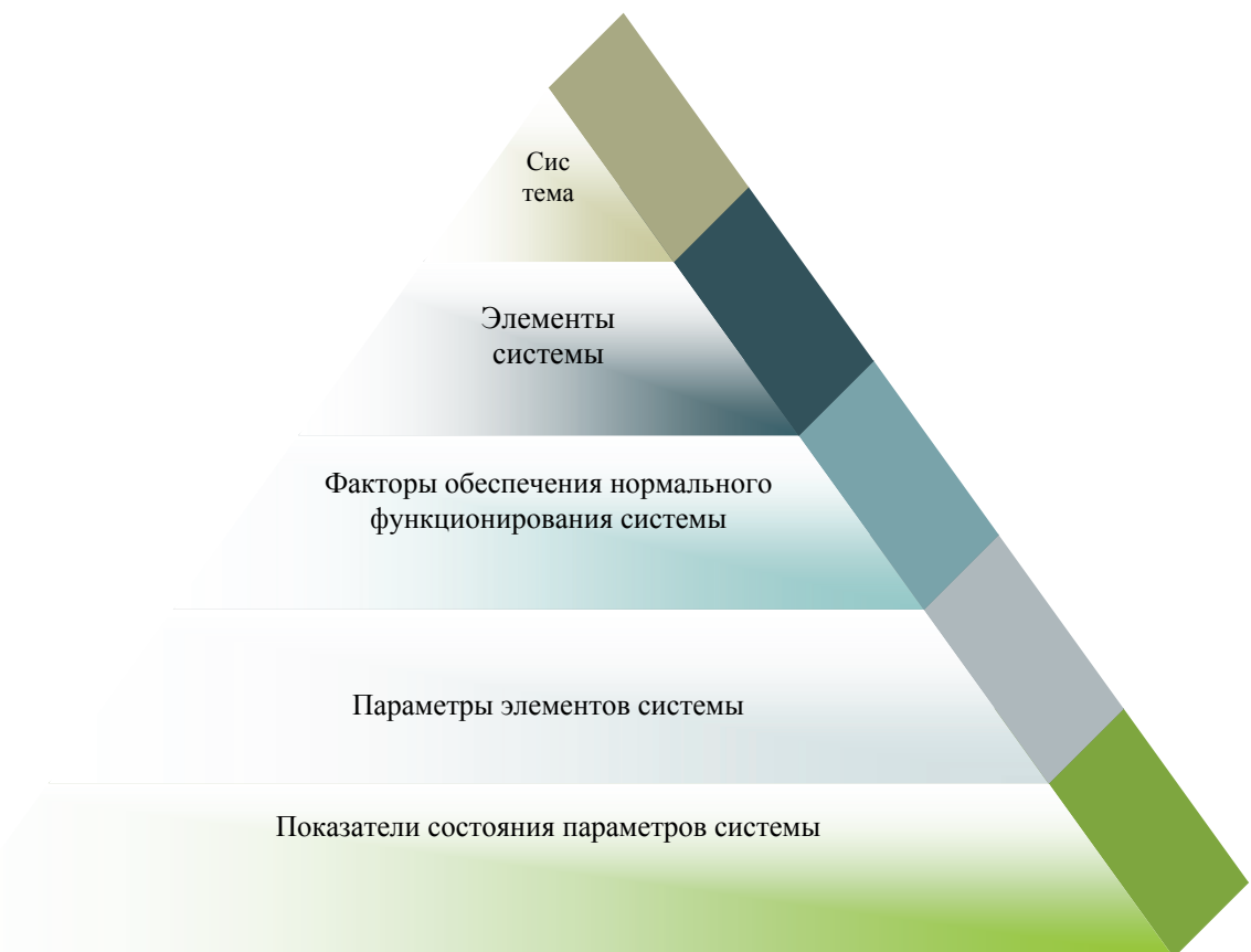
Рис.1. – Формализация представления о системе внутреннего контроля предприятия посредством спектрального анализа

С другой стороны целью создания системы ВК на предприятии является поддержание объекта управления в заданном режиме. Достигается это посредством своевременного предоставления информации о состоянии объекта и путем предотвращения негативных последствий неоправданной хозяйственной активности. При этом информация должна соответствовать необходимым требованиям. Следовательно, качеством информации, получаемой в результате внутреннего контроля, определяется эффективность функционирования СВК.