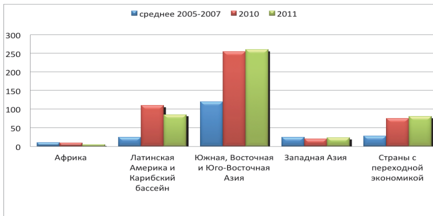
Рис. 2. Потоки ПИИ по группам стран в 2005-2007, 2010 и 2011 гг., млрд. долл. США [5,6]

Рост ПИИ из развивающихся стран за последние несколько лет потерял некоторый импульс к росту за счет снижения оттока ПИИ из стран Латинской Америки и Карибского бассейна, а также замедлился рост инвестиционных потоков из развивающихся стран Азии (рис. 2).