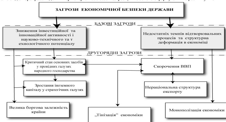
Рис.1 Система та ієрархія загроз у національній економіці

Однак, на погляд автора треба виділити першочергові або базові загрози, які є основою формування та розвитку низки інших (рис.1).