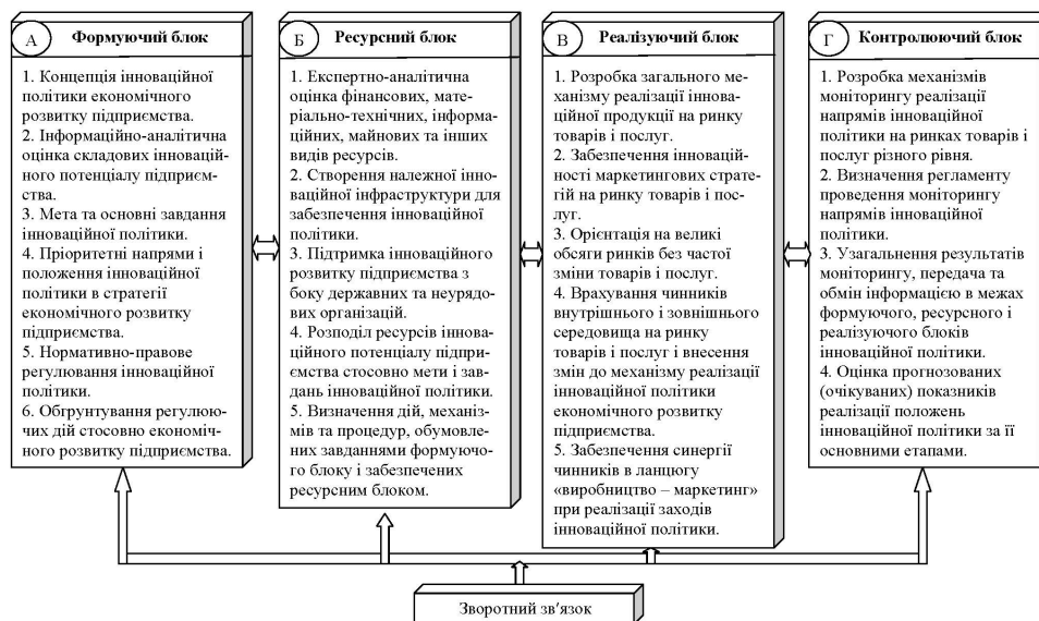
Рис. 3. Зміст основних блоків інноваційної політики економічного розвитку підприємства

Висновки. Інноваційний розвиток промислового підприємства в умовах трансформаційної економіки повинен здійснюватися на засадах виваженої, обґрунтованої, довгострокової інноваційної політики, що передбачає вибір стратегії, оцінку наявного інноваційного потенціалу, виокремлення провідних проблем інноваційного розвитку підприємства, розробки та реалізації системних пріоритетних заходів щодо їх вирішення. Все це обумовлює врахування складових інноваційної діяльності сучасного підприємства в ланцюзі «маркетинг – виробництво інноваційної продукції і послуг» та змістовне наповнення основних блоків інноваційної політики економічного розвитку підприємства в системі інноваційного менеджменту.